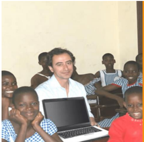
Programa TICS FOR ALL