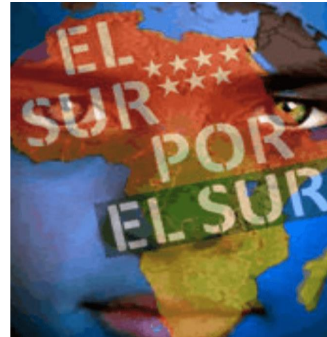
EL SUR POR EL SUR