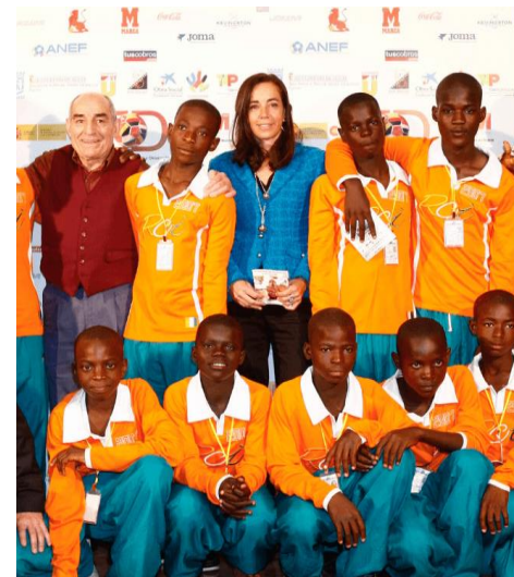
LIVRO NA MAO, BOLA NO PE