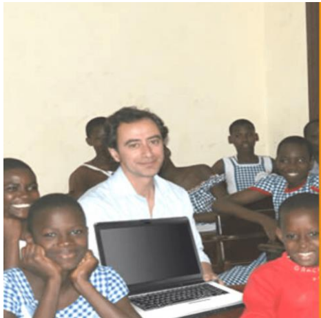
Programa TICS FOR ALL