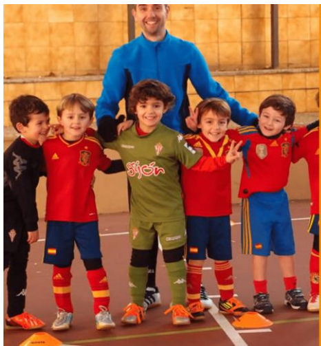
CostaGijón Escuela Deportiva