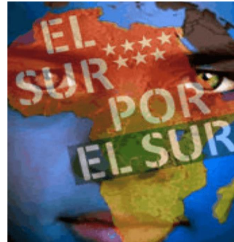
EL SUR POR EL SUR