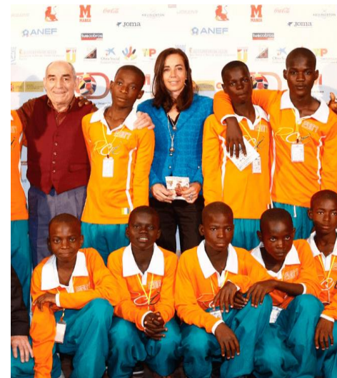
LIVRO NA MAO, BOLA NO PE