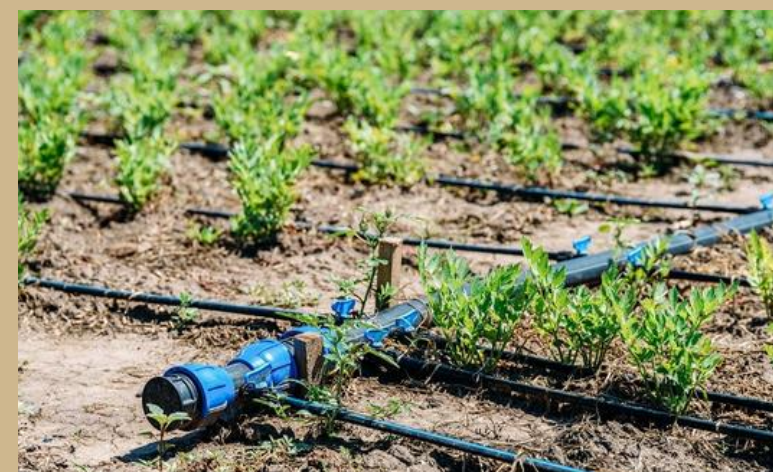
ADQUISICIÓN DE SISTEMAS DE RIEGO