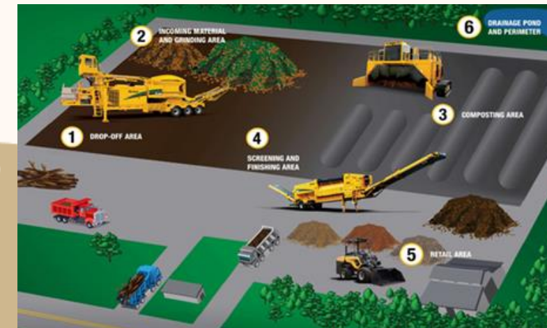
UNIDAD PARA LA PRODUCCIÓN DE BIO FERTILIZANTE