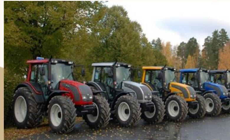
APORTE DE MAQUINARIA AGRÍCOLA