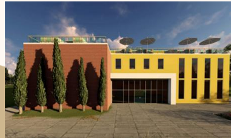
ÁREA DE FORMACIÓN PROFESIONAL