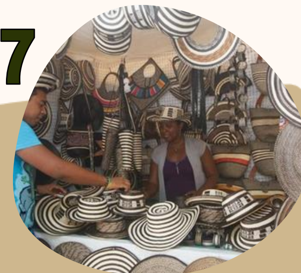
7 ENTORNO EMPRESARIAL