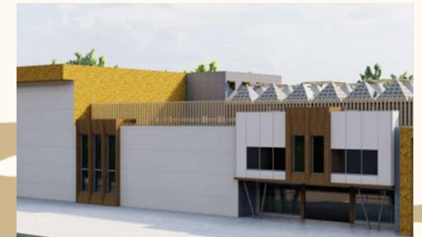
ÁREA DE ATENCIÓN ASISTENCIAL