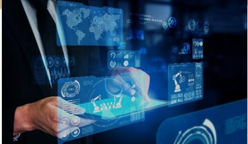
PLANES ESTRATÉGICOS PARA EL MERCADEO DE PRODUCTOS