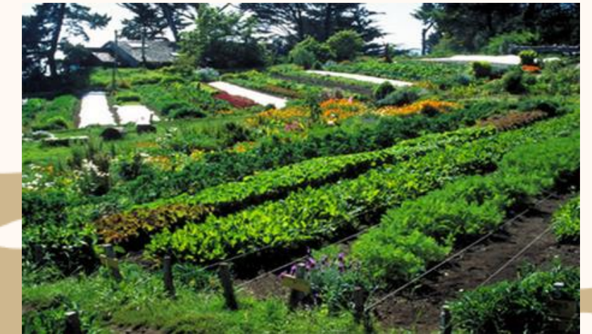
IMPLEMENTACIÓN DE LA AGROECOLOGÍA Y ECONOMÍA CIRCULAR