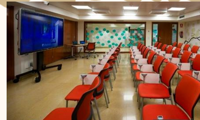
SALA DE CONFERENCIAS Y CAPACITACIONES