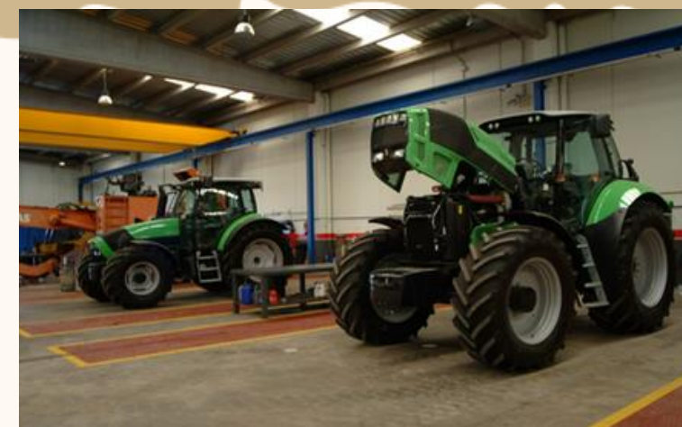
MANTENIMIENTO Y REPARACIÓN DE MAQUINARIA Y EQUIPOS