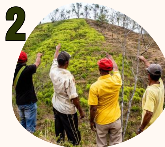
2 ENTORNO AMBIENTAL Y SANITARIO