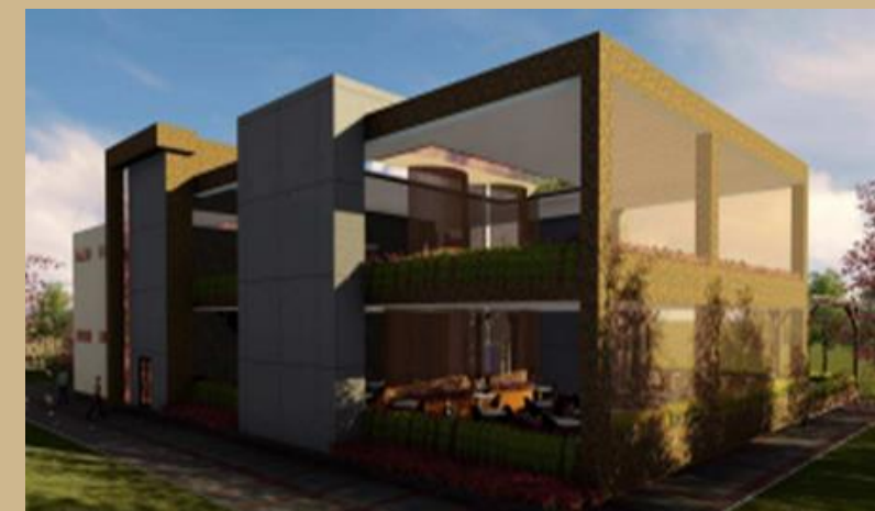
RESTAURANTE Y COMEDOR