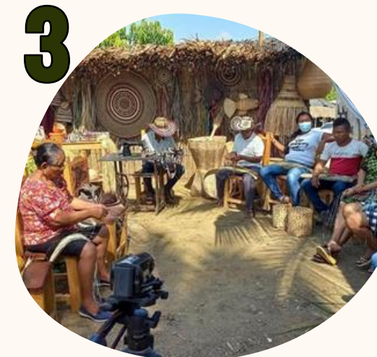
3 ENTORNO POBLACIONAL, ÉTNICO Y CULTURAL