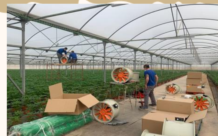
BIOFÁBRICAS VEGETALES CLIMATIZADAS