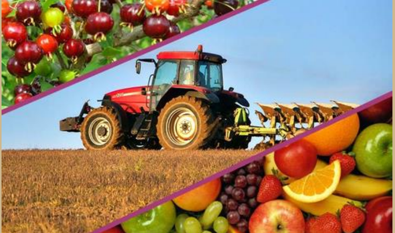
ANÁLISIS Y ESTUDIO DE MERCADO NACIONAL