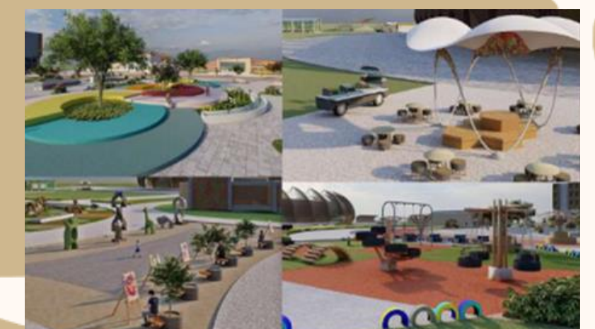
ÁREA DE DESCANSO, RESTAURACIÓN Y SERVICIOS