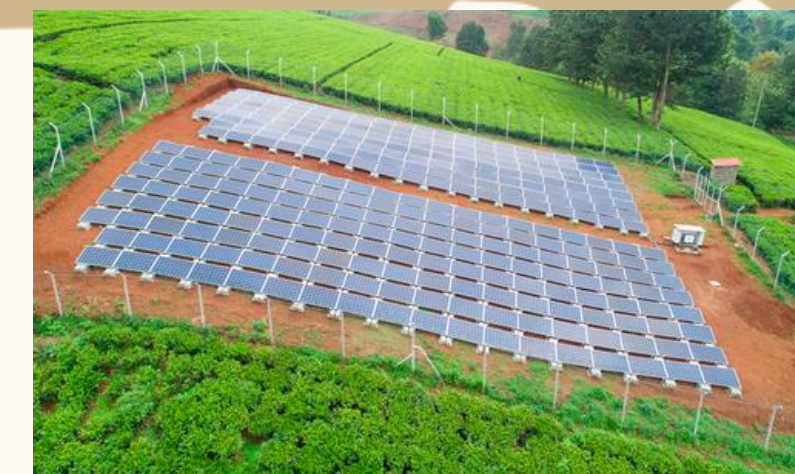
MONYAJE DE SISTEMAS SOLARES FOTOVOLTAICOS