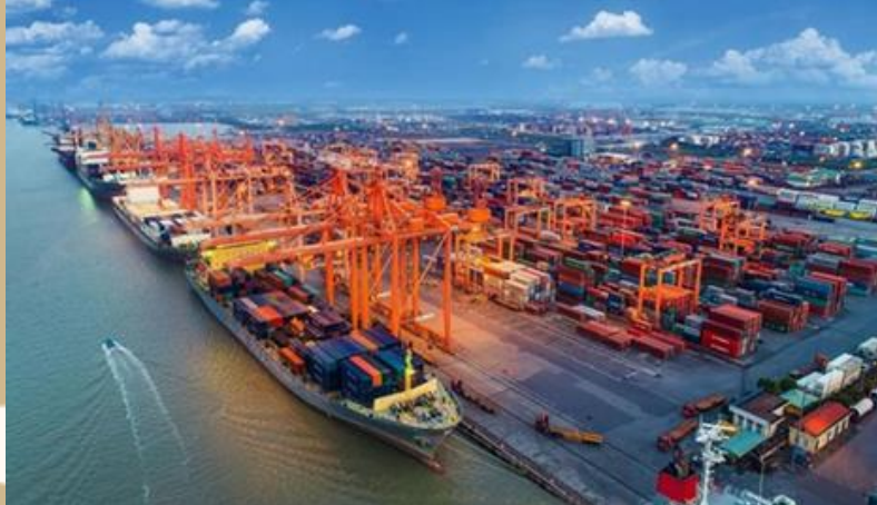
COMERCIO INTERNACIONAL DE PRODUCTOS AGROFORESTALES