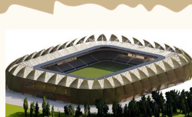
ÁREA DE FORMACIÓN DEPORTIVA MULTIDISCIPLINARIA CON NORMATIVIDAD OLÍMPICA PARA EL ALTO RENDIMIENTO DEPORTIVO