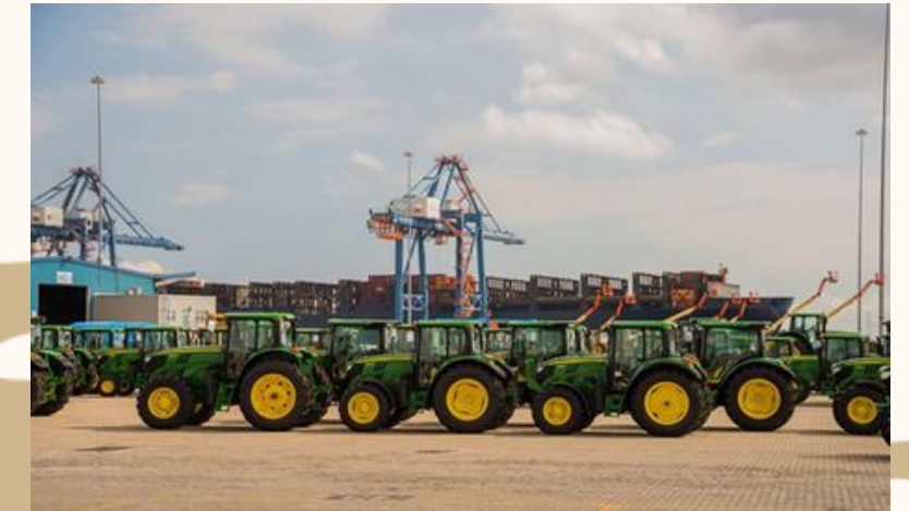
SELECCIÓN, ADQUISICIÓN Y CERTIFICACIÓN DE LA MAQUINARIA