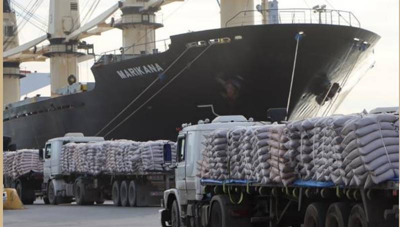
ANÁLISIS Y ESTUDIO DE MERCADO EXTERIOR