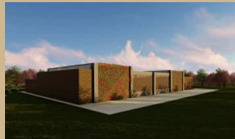
SALONES DE USOS MÚLTIPLE