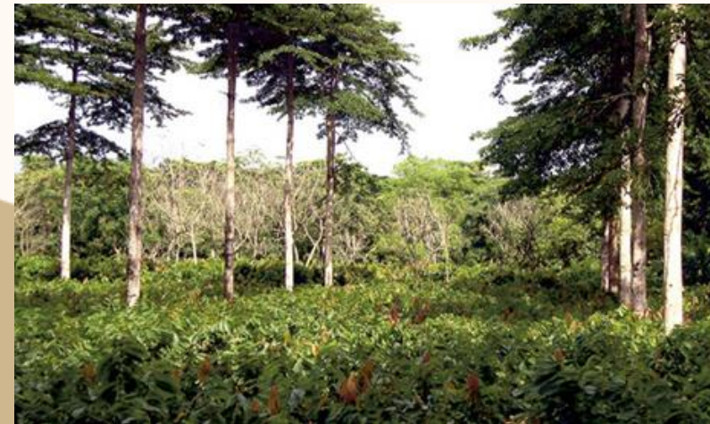
DISEÑOS Y ESTABLECIMIENTOS AGROFORESTALES