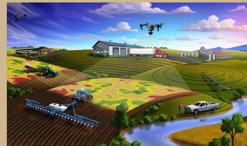
IMPLEMENTACIÓN DE AGRICULTURA DE PRECISIÓN