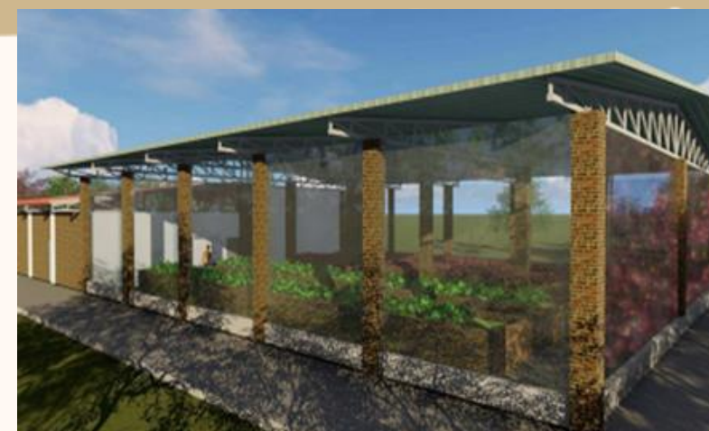
ÁREA DE SOSTENIBILIDAD ENERGÉTICA, BIOFÁBRICA VEGETAL, MANTENIMIENTO Y ALMACENES