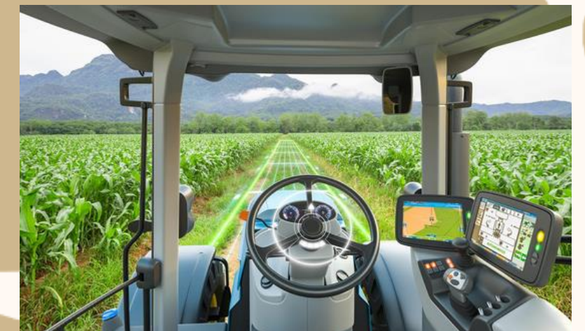
ADQUISICIÓN DE EQUIPOS PARA LA AGRICULTURA DE PRECISIÓN