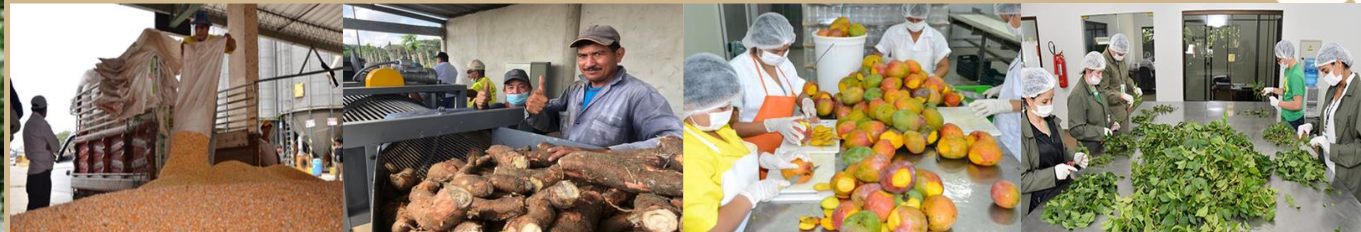
UNIDADES PARA LA TRANSFORMACIÓN AGROINDUSTRIAL DE GRADOS 1, 2 Y 3 CEREALES, TUBÉRCULOS, FRUVER, PLANTAS MEDICINALES Y AROMÁTICAS