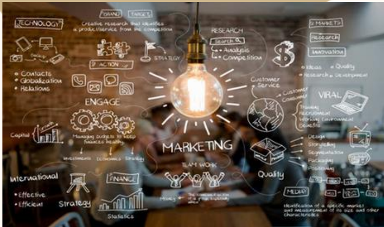
PROCESOS DE MARKETING Y PUBLICIDAD, Y SISTEMATIZACIÓN DE MODELOS DE NEGOCIOS