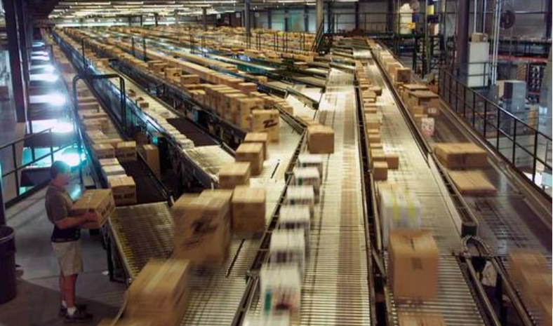
FORTALECIMIENTO DE LA GESTIÓN SOLIDARIA