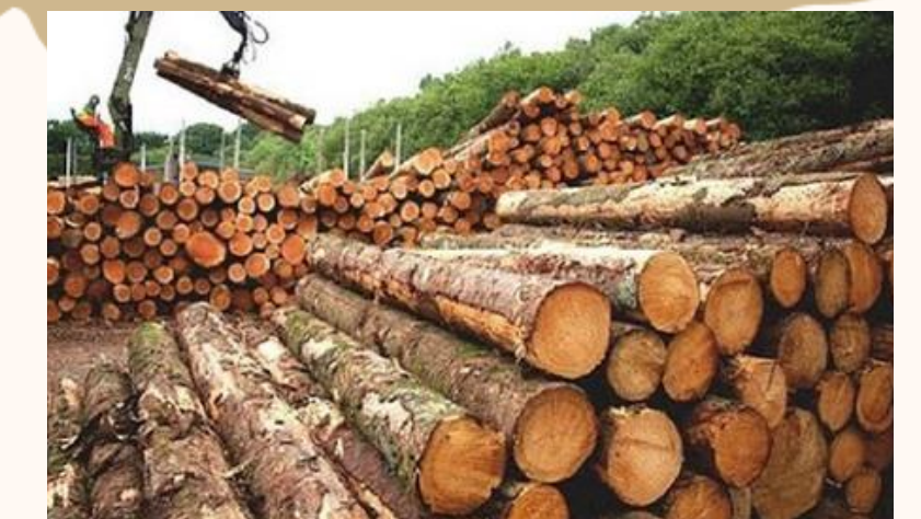
TRAZABILIDAD, SELLO ORGÁNICO Y CUSTODIA FORESTAL