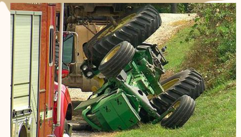
GARANTÍAS, PÓLIZAS Y VALORACIONES DE SINIESTROS Y/O AVERÍAS