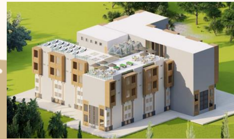
ÁREA DE VIDA, ADMINISTRACIÓN Y SERVICIOS