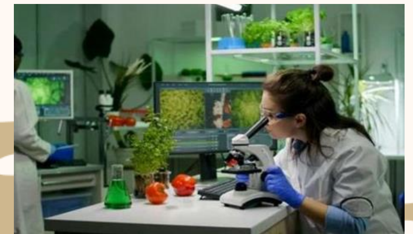
LABORATORIO DE SUELOS, AGUAS Y MUESTRAS FITOSANITARIAS