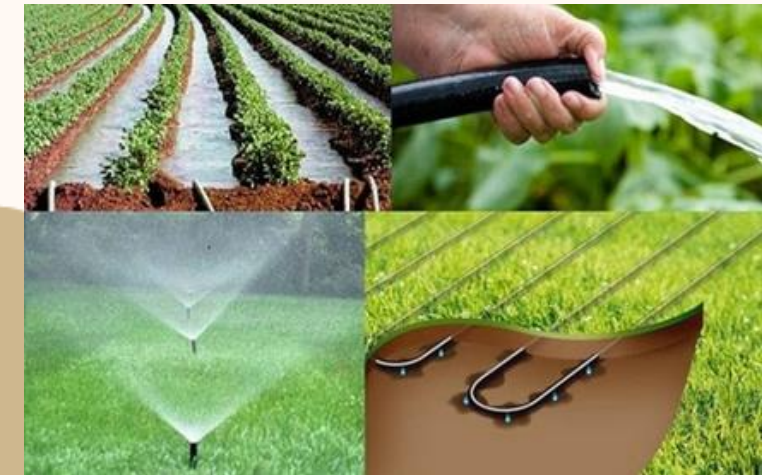
DISEÑOS ESTRATÉGICOS DE SISTEMAS DE RIEGO