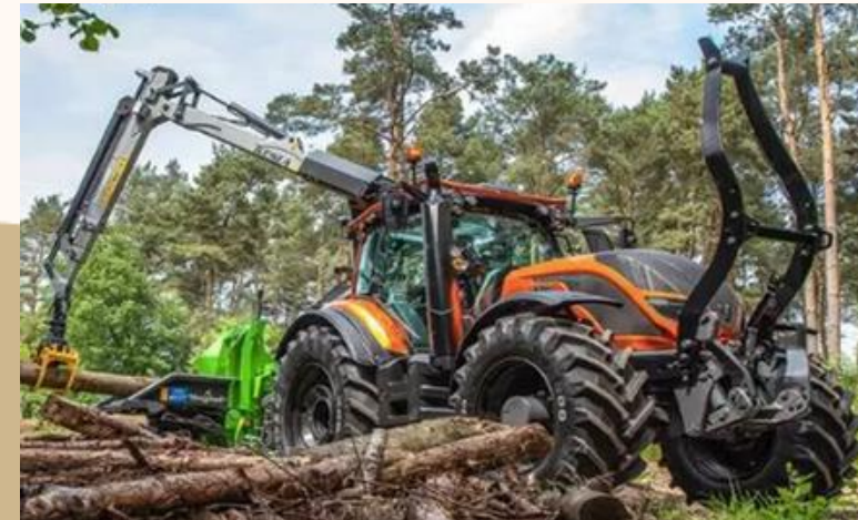
APORTE DE MAQUINARIA FORESTAL