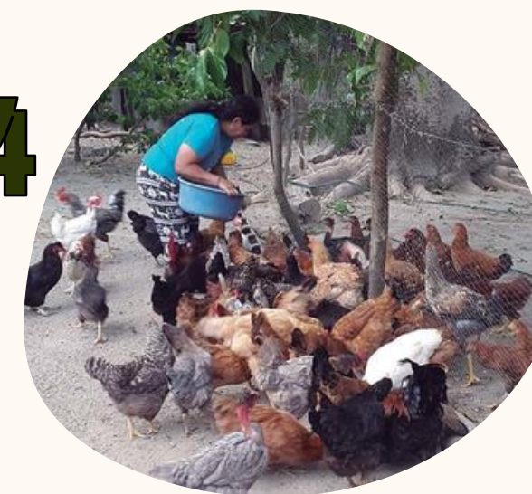
4 ENTORNO PRODUCTIVO PECUARIO