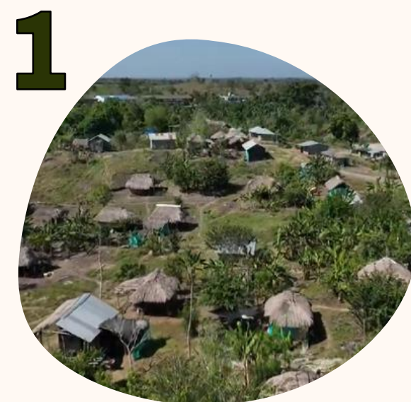
1 ENTORNO SOCIAL Y COMUNITARIO