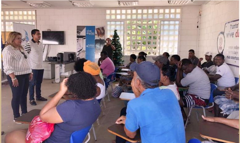
FORTALECIMIENTO DE PROCESOS DE ASOCIATIVIDAD