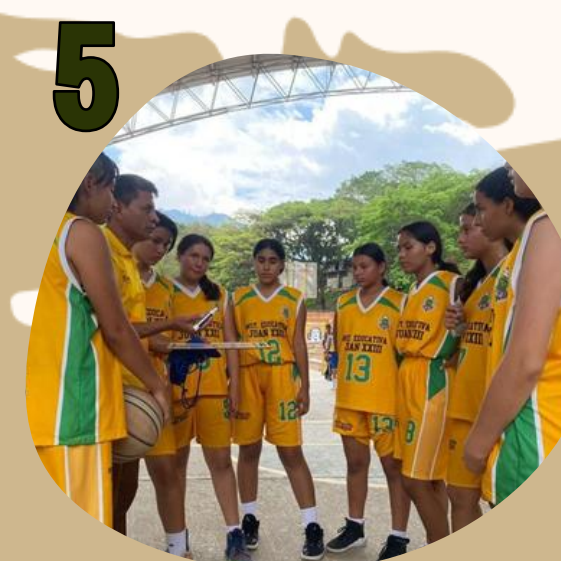
5 ENTORNO EDUCATIVO/DEPORTIVO