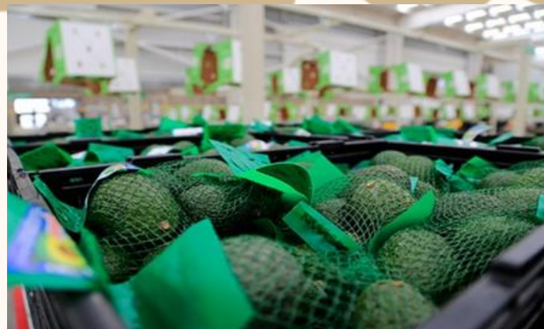
LOGÍSTICA, INCOTERMS Y ADUANAS