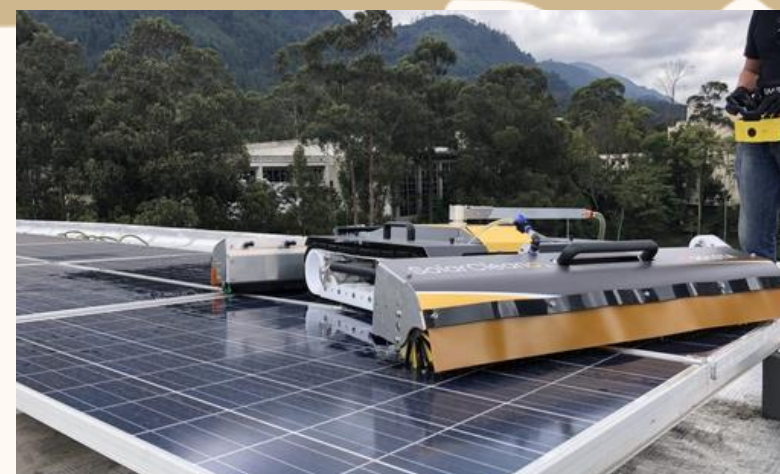
ADQUISICIÓN DE EQUIPOS PARA LOS SISTEMAS SOLARES FOTOVOLTAICOS