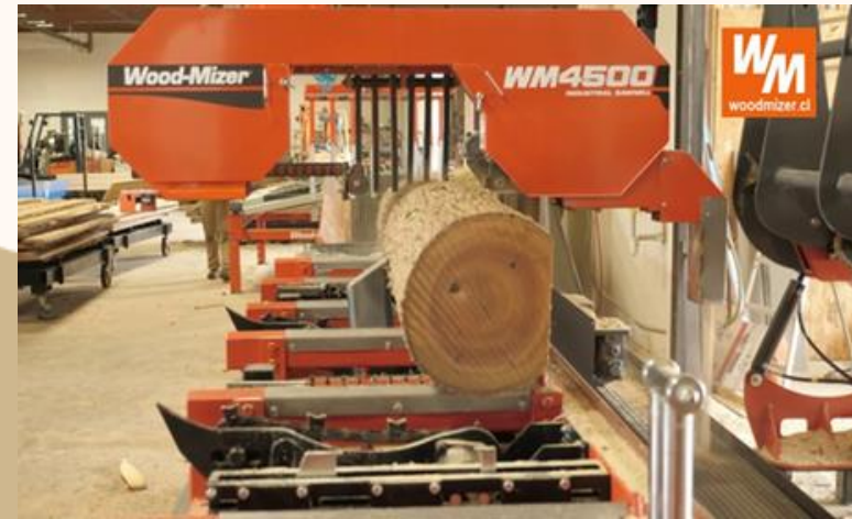
UNIDAD PARA LA INDUSTRIA DE LA MADERA