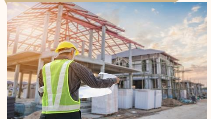
DISEÑOS Y ESTUDIOS TÉCNICOS DE OBRAS CIVILES