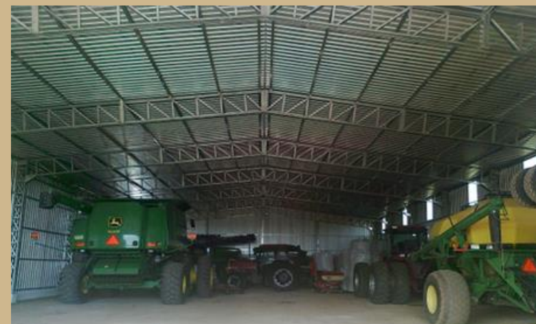
CONSTRUCCIÓN DE INSTALACIONES PARA EL PARQUE DE MAQUINARIA