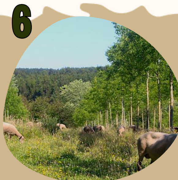
6 ENTORNO PRODUCTIVO AGROFORESTAL