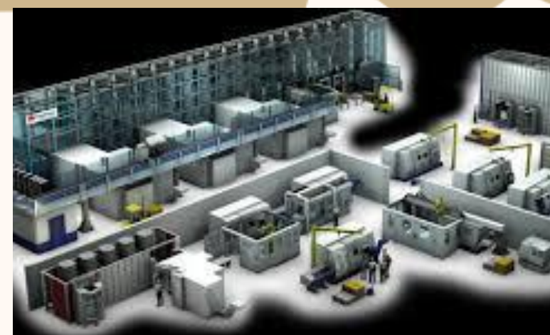
ADQUISICIÓN DE EQUIPOS Y DOTACIONES PARA LA PLANTA DE TRANSFORMACIÓN